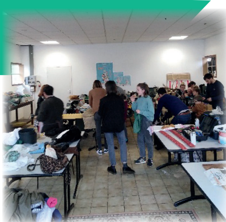
Préparatifs du Carnaval / Ihauterietako prestaketak