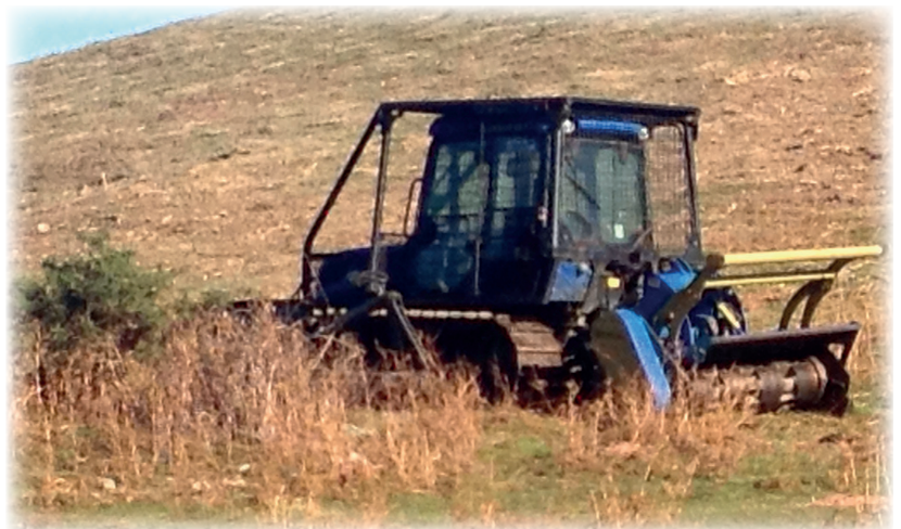
Achat d'un gyrobroyeur / mendi ta larre garbitzeko tresna baten erosketa

Kostu gastuak : 5.162 €. Diru laguntzak : 4.130 €.