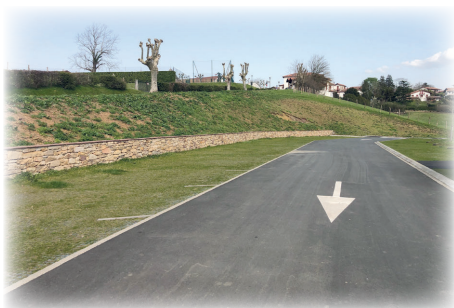
Parking Ecole St Joseph / San Josepe eskolako aparkalekua

Ikerketaren emaitzaren peskizan, halere, Zazpiak Bat euskal dantza elkartearentzat lokal bat antolatzen hasi da herria. Herriko zerbitzu teknikoek barnea suntsitu eta lanak egin dituzte. Bukatze lanak egingen dira 2022ko bigarren hiru hilabetekoan.