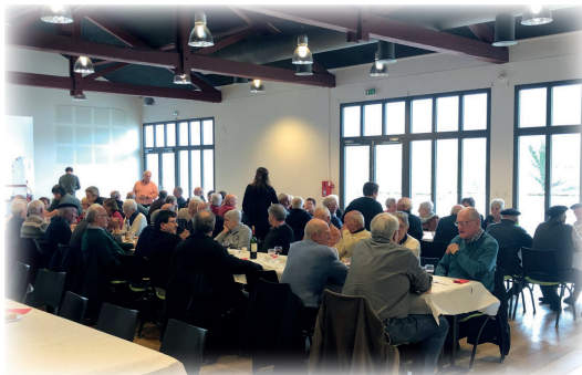
Repas Tripotx / Tripotx bazkaria

2022ko otsailaren 18ko herriko kontseiluan, Sarako herrian GEUZ bat sortzearen alde bozkatu zen. 9 kidek osatuko dute GEUZen administrazio-kontseilua (4 hautetsik eta zenbait elkarte berezitako 4 kidek, auzapezaren lehendakaritzapean). Administrazio zerbitzu honek ahalmen anitz ditu: tokiko gizarte-ekintzaren sustatzailea da, legezko gizarte-laguntzako eskarekin instrukzioan parte hartzen du, legez kanpoko aukerako laguntzaren esleipena kudeatzen du eta gizarte-prebentziorako ekintzak sustatzen ditu.