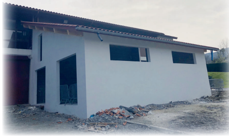
Local stockage Salle polyvalente / kiroldegiko biltegi lokala

Dans cette attente, la commune a, cependant, débuté l'aménagement d'un local pour l'Association de Danses Basques Zazpiak Bat. Les services techniques municipaux ont réalisé en interne la démolition de l'intérieur et le 2 nd œuvre. Les finitions sont programmées pour le 2 e trimestre 2022.