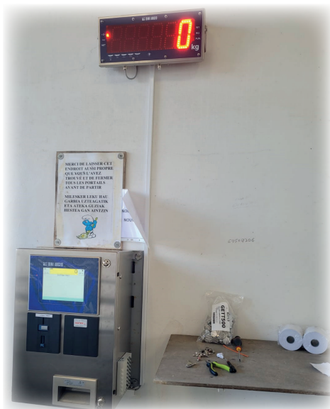
Pesée communale / herriko pisuak