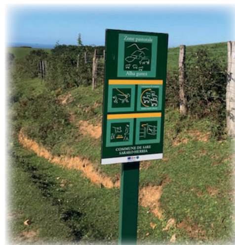
Panneau protection du pastoralisme Artzaintza babesteko argibide taulak

Ahuntz pirenaiak hazteko gogoia duen gazte batek galdea egin ondoan, kontratu bat egin zen harekin, lursail hauek balia ditzan.