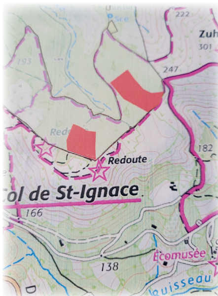
Plan relance ONF / ONF berjaurtiketa planoak