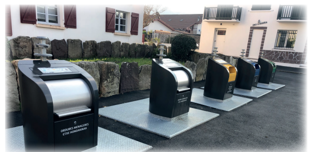
Tri des déchets au bourg / herri zentroko zikin bereizte tokia

Obra handiak zerbitzu teknikoetako herriko langileek egin zituzten.