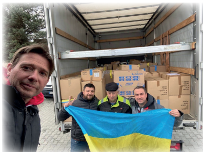
Livraison en Ukraine / Ukrainiarat ekarririk