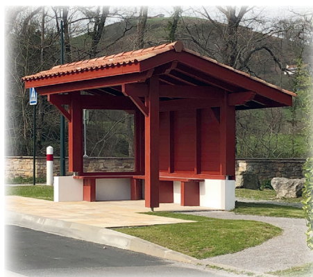
Abribus à Argaina / Argaineko autobus aterbea

En 2022, un aménagement piéton sera réalisé pour faciliter l'accessibilité de ce parking au centre-bourg, aux commerces et aux équipements sportifs communaux.