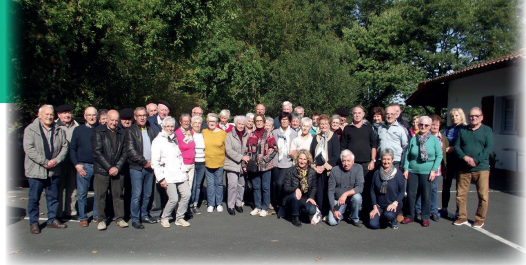
Sortie à la Rhune / Ateraldia Larrunerat

Il va sans dire que notre projet de logements sociaux à l'ancien presbytère sera le bienvenu et très attendu par tous.