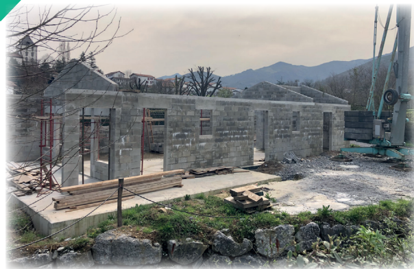
Construction du funérarium/ hiletxearen eraikitzea

Remerciements également aux agents communaux des services techniques qui sont immédiatement intervenus pour la mise en sécurité des voiries inondables et inondées. Remerciements aux Pompiers et à leur chef de centre pour leurs nombreuses interventions rapides sur la commune.